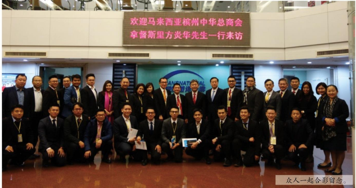
眾人一起合影留念。