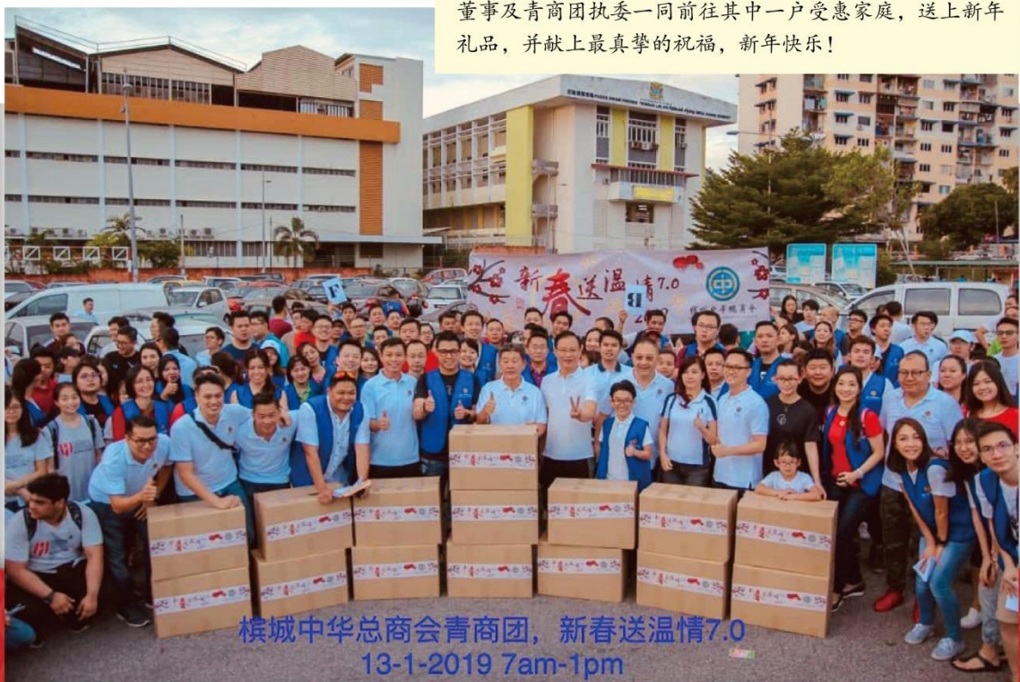
檳城中華總商會青商團，新春送温情7.0 13-1-2019 7am-1pm