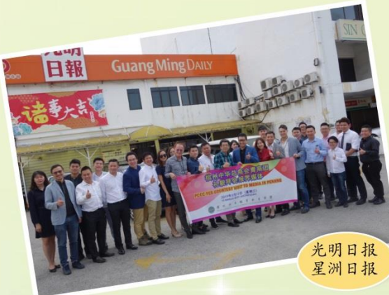
光明日報 星洲日報