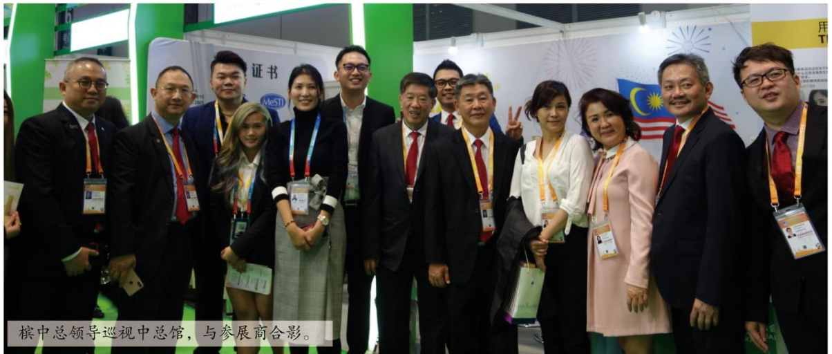
檳中总领导巡视中总馆，与参展商合影。

马来西亚中华总商会于此展会设立中总馆（马来西亚），一共设有30个展位28家企业参展。参展领域包括食用油、饼干、酱料、零食、咖啡、燕窝、天然矿泉水、方便面、传统草药及健康食品等。