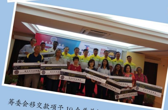
籌委會移交款項予10個慈善機構。