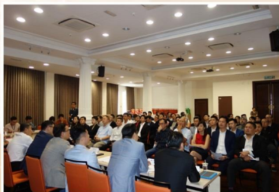
团员们踊跃出席会员大会。

打工族、创业刚起步或正在创业的年轻人，我们都欢迎。”他表示，以前创业时，与著名企业家共餐及交流是不可能的事，而檳中总则聚集各行业的商业名流，从而互相交流，把不可能化为可能。