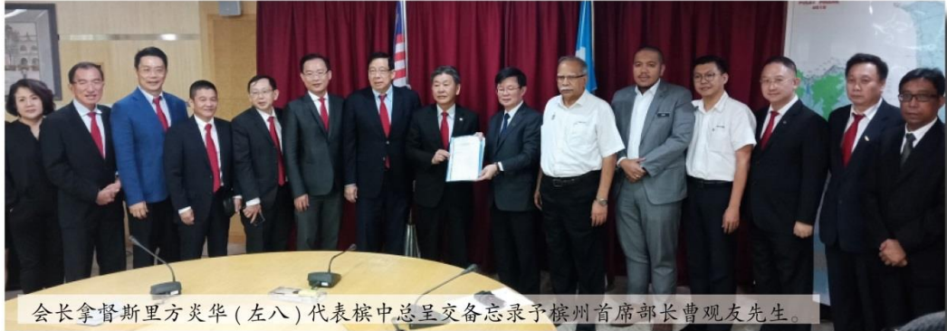
会长拿督斯里方炎华(左八)代表槟中总呈交备忘录予槟州首席部长曹观友先生。

本会执行董事一行 16 人在会长拿督斯里方炎华的带领下，于 2019 年 4 月 1 日（星期一）下午 5 时 45 分前往拜会槟州首席部长曹观友先生，进行闭门会议及呈交备忘录。